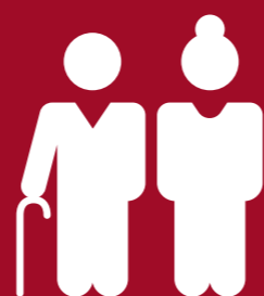
Rentenbezüger (Anzahl Renten)