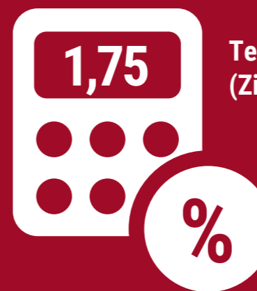
Technischer Zinssatz (Zins Deckungskapital Renten)